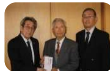
大玉村老人クラブ連合会様