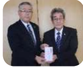
二本松市・安達地区 労働福祉協議会 様