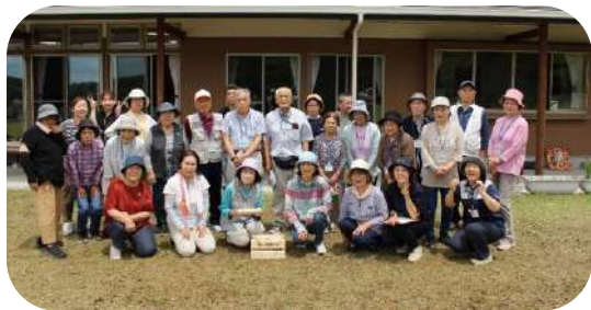
三春町平沢団地のみなさんとモルックで交流会