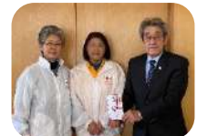
大玉村赤十字奉仕団様