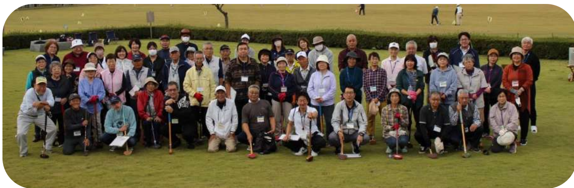
本宮・大玉・二本松合同サロン

夏ボラ体験「避難者地域支援コーディネーターの活動を知ろう」では大玉中学校の生徒さんとポッチャで交流しました。参加者の目じりが下がります〜。